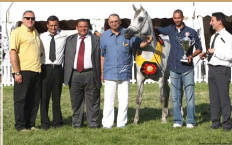
Mahala Gold Medal Mares Frankfurt Egyptian Cup 2008 owner: Rabab Stud (Egypt)